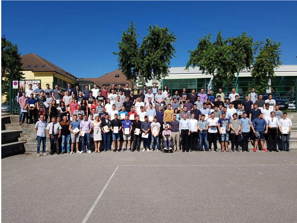
Slika 1: Maturanti spomladanskega roka 2017